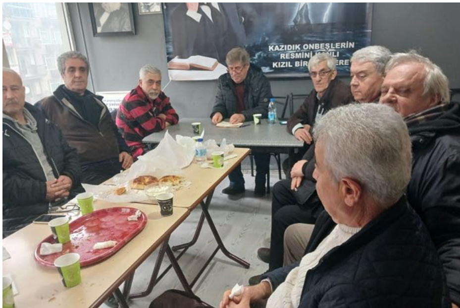
Bursa'da düzenlenen anma etkinliğinde sunum konuşmasından sonra katılımcılar canlı bir sohbet ortamında 3 saate yakın görüşlerini dile getirdiler.

Etkinliğin sohbet kısmına geçilmeden önce yarım saati aşkın sunum yapıldı. Sunumda 1800'lerden 3. Enternasyonal'e kadar sınıf mücadelesinin gelişimi, zaaf lar, sapmalar ve Marksizmin bilim olarak ortaya çıkışı, kapitalizmin tekeli ve emperyalist sürece yükselmesiyle Lenin'in sınıfın bilimine ilerletici noktadan katkısı ve bu çizgide Mustafa Suphi ve TKP'nin konumu vurgulandı. Ekim devriminin, Türkiye halklarının bağımsızlık ve özgürlük mücadelesi içinden doğan Suphilerin çizgisinden en ufak bir sapmanın nelere mal olduğunu; ihanet, likidasyon, teslimiyet sonucu oluşan burjuva ideolojisine